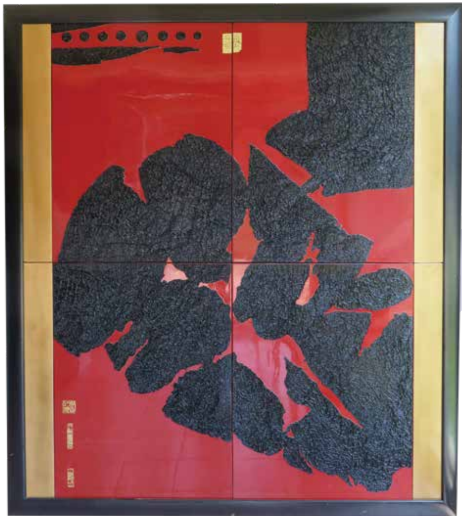
浮生時帖—歡愉(修護前)