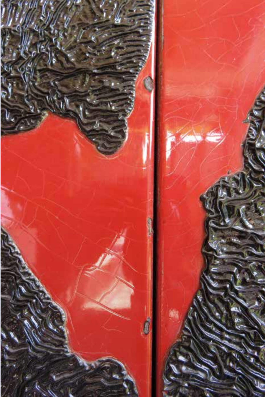
劣化狀況漆料剝落