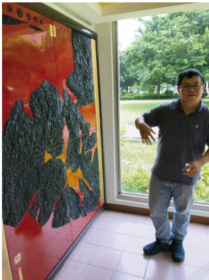
修復完送回藝術中心，修復師熱心講解修復過程

雖然進行藝術品修復是一件耗費時間、心力與金錢之事，一位具有才德的修復師往往具備多重的知識和技能，也需十分熟稔媒材和工具之運用，在面對經手修復的作品也需具備創作知識的認知與藝術史觀。