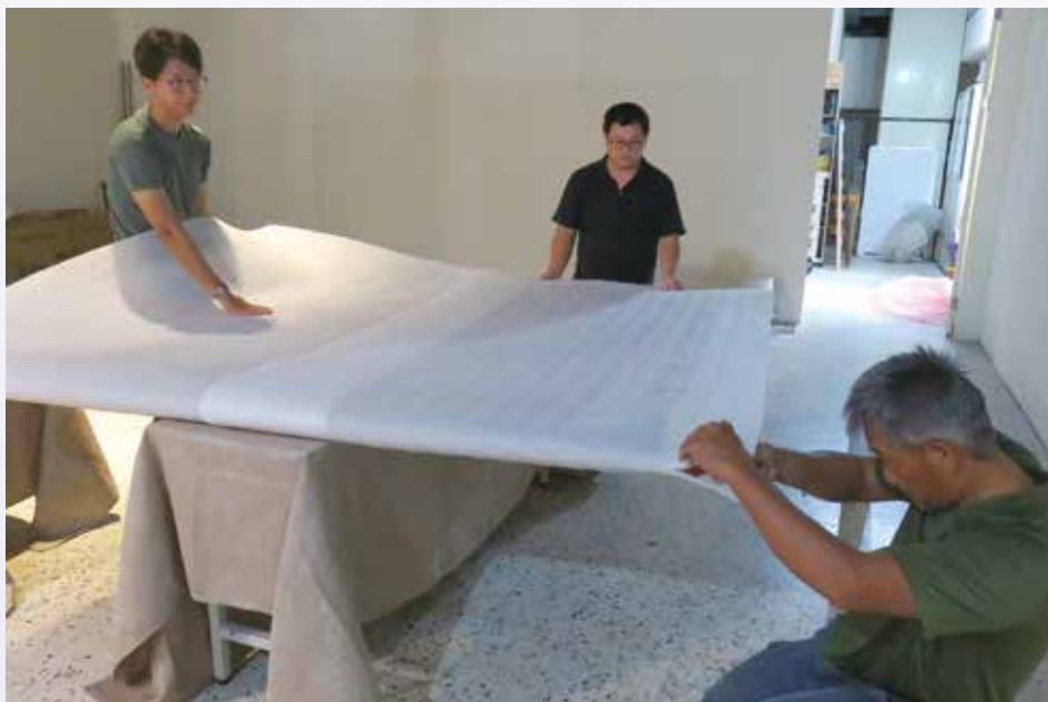
修復師進行文物包裝

「浮生十帖—歡愉」是藝術家李錫奇2002年的作品，於2008年時，成大舉辦世代對話校園藝術節時購入典藏。李錫奇(1938-2019)生於金門古寧頭，是臺灣現代藝術領域少數個人創作成長與藝術成就同時俱進的藝術家，1955年進入臺北師範學校藝術科就讀，1958年與楊英風、秦松、陳庭詩即將和江漢東成立「現代版畫會」。李錫奇於1959年開始參加國際性大展，多次榮獲國際藝術大獎，並在1963年正式加入戰後臺灣最重要的美術組織—「東方畫會」。李錫奇的作品有兩個特色：一是來自民間由金門的鄉土出發，融合傳統的民族因素的潛在影