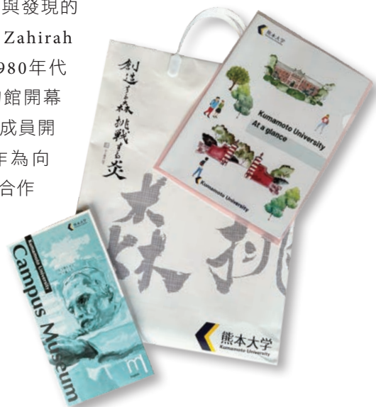
松永教授提供之文宣，文宣上皆有漫畫家井上雄彥題字「創造する森 挑戦する炎」。

(Collaboration is Cultural Diplomacy)」為指導原則，展現與亞洲、東協各國的合作成果。然而既身為大學博物館，除了跨國合作，他們也持續強化與校園社群的夥伴關係，包含各領域的教師、研究人員和學生，致力於將博物館轉型為一座活的實驗室，鼓勵各方進行以物件為本的研究、開發數位工具、提出創新策展構想，使大學博物館成為大家投入實驗、創意與發現的空間。最後，Zahirah主任以一張1980年代亞洲藝術博物館開幕典禮上由王室成員開門的照片，作為向各方敞開交流合作之門的象徵為總結。