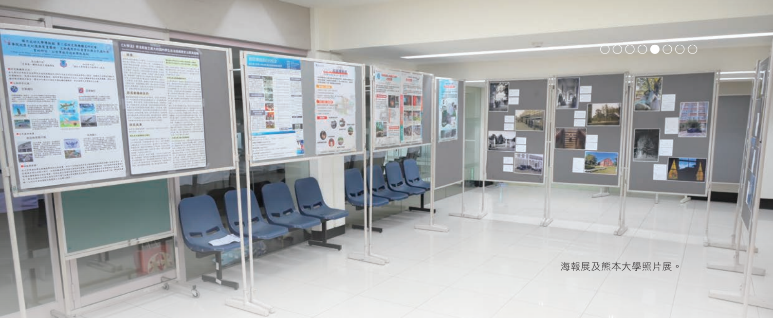
海報展及熊本大學照片展。