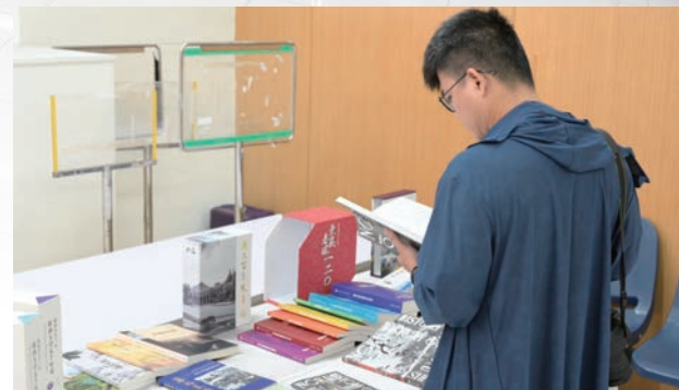
與會者翻閱微型書展出版品。

戴老師在演講時先播放賓士的巴士自1895年到2025年的演變影片，讓她感覺到這一百多年的演變被濃縮在一分多鐘，或許也表現了某種程度的機構的制度史，然而我們看不到誰在駕駛、誰是乘客、這些公車出現後對當地的影響，以及它的轉型是否也跟當時社會有所連結。第一個案例是「史語所成立初期與法國漢學界的互動——以蔡元培、傅斯年、伯希和為主線的初探」，從書信、聘書、各式檔案等觀察史語所在當時想將國際漢學中心奪回中國的歷史背景下，觀察中國與法國漢學界的人員互動。第二個案例是「尋找早期女性學者」，以曾昭燏為例，考量南京博物院已有不少相關出版