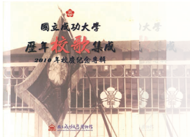
圖 6. 歷年校歌集成 DVD。

2010年，成大博物館完成過去所有校歌之重新演唱：台灣總督府台南高等工業學校校歌、台南州立台南專修工業學校第一與第二校歌、台灣省立工學院校歌、省立成功大學以後至今的校歌，共七首。這些重新翻唱的校歌，壓製合成DVD(圖6)，內附各個校歌之歌譜、作詞、作曲、演唱者之詳細資訊，於同年11月校慶時贈送來賓。