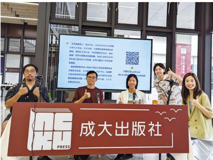
成大出版社live podcast現場合影。