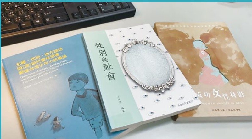
EP.04~EP.06性別的迴響，著作書封。