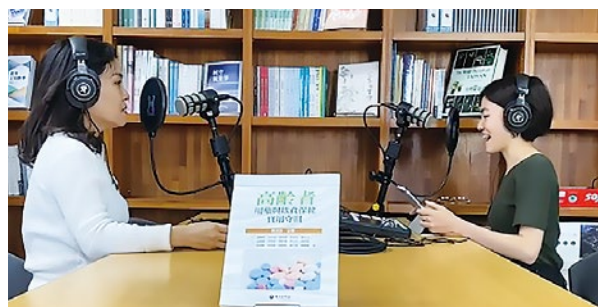
EP.02 高齡生活指南：用藥及保健。