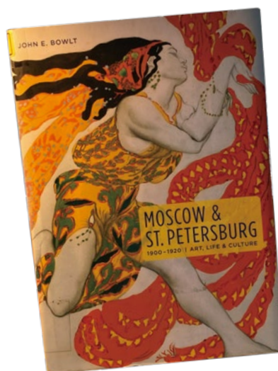
封面為巴克斯特為1911年“Narcisse”之酒神角色設計的服裝。

革命前的俄羅斯藝文生活是豐富且令人陶醉的。從金碧輝煌的歌劇院、卡巴萊與各種實驗劇場，從美輪美奐的各式展覽到小型私人沙龍，在傳統與前衛思潮交互衝擊之下，20世紀初期的俄羅斯藝文型態，呈現出前所未有的繁榮景象。此時位於世紀交替的白銀時代，俄羅斯文化生活各個方面的根本變化。這是一個舊傳統仍舊鞏固存在，而新的思潮與美學觀卻又迫不及待的等待萌芽的時代。在文學上產生象徵主義(Russian symbolism)、阿克梅主義(Acmeism)、俄羅斯未來主義(Russian Futurism)、意象主義(Imaginism)等文藝思潮，在戲劇上建立了表演藝術的基礎。此時風格各異的藝術團體：印象派、前衛主義、樸素主義、立體未來派、至上主義、抽象畫派、藝術世界等等，他們同時存在在同