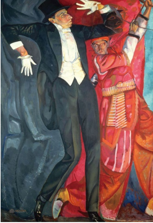
鮑里斯·格里戈里耶夫，〈梅耶荷德扮演 Archer 與 Dandy 的角色〉，畫布、油料，247×168 cm，1916，俄羅斯博物館。