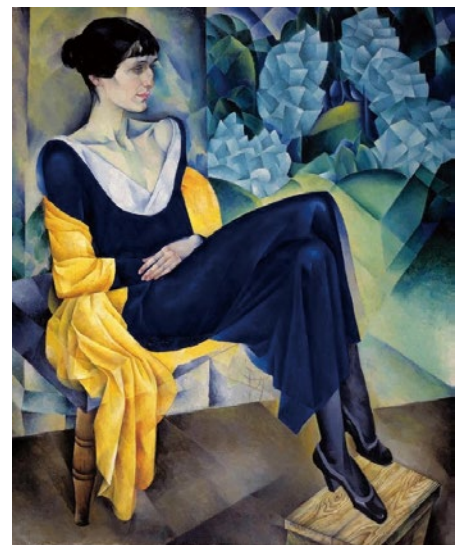
內森·奧爾特曼 (Nathan Altman, 1889-1970)，〈安娜·阿赫瑪托娃肖像〉，畫布、油料，123.5×103.2 cm，1914，俄羅斯博物館。

想知道100年前這群不受傳統束縛，自由恣意，不想睡的他們，如何度過深夜兩三點的浪漫之夜？不妨到成大圖書館借閱“Moscow & St. Petersburg 1900-1920: Art, Life, & Culture of the Russian Silver Age”，你會發現，沒有3C的人生，亦是如此豐富有趣。所謂的波希米亞圈為這個有著獨特的生活型態、氣質行為和風格品味的時代，留下了珍貴的風采與文化印記。