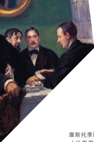
庫斯托季耶夫 (Boris Kustodiev, 1878-1927)， 〈世界藝術協會藝術家〉。畫布、油料，52 × 89 cm，1920，俄羅斯博物館。