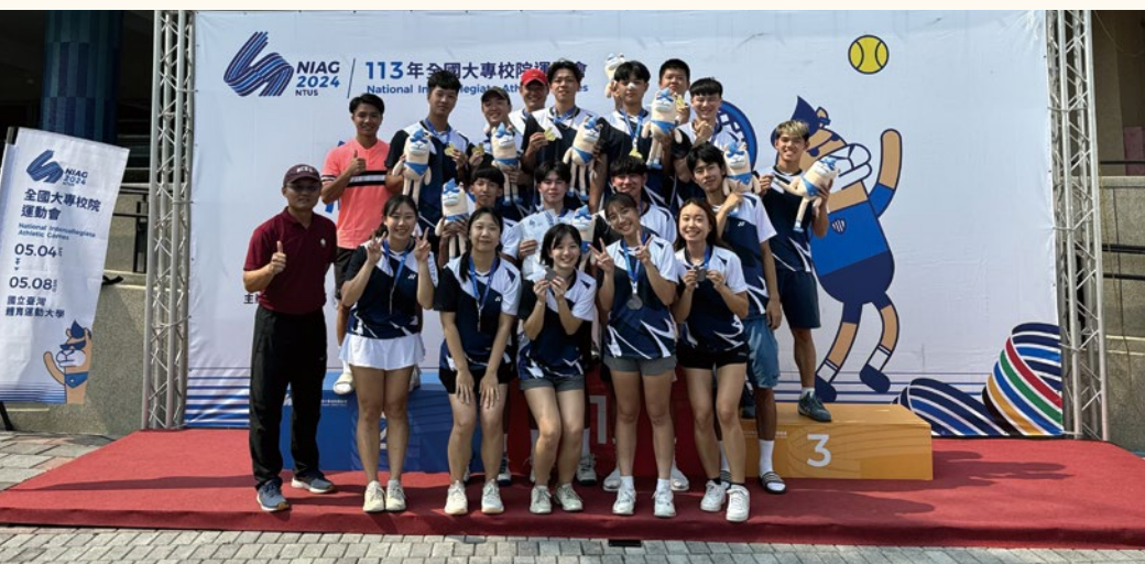
113年全國大專校院運動會 成大獲 6 金 17 銀 14 銅 男網冠軍締造四連霸。