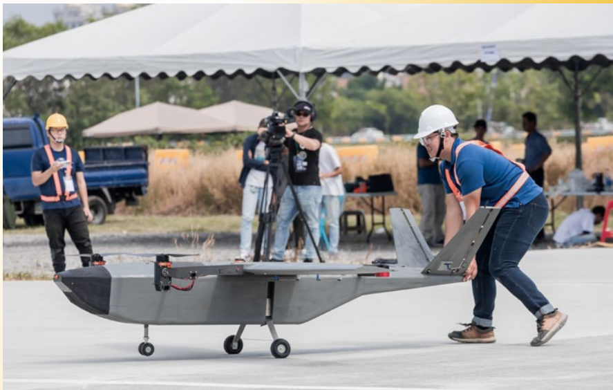
第二屆國防應用無人機挑戰賽開始報名 330 萬高額總獎金重磅登場。

國立成功大學臺灣學「Formosa 俛海 e 所在」於 6 月 1 日至 7 日在光復校區歷史文物館舉辦「2024 臺灣聲影 視界幻化」活動，展示學生深掘與運用在地素材後創作出的獨具風格的臺灣研究作品。