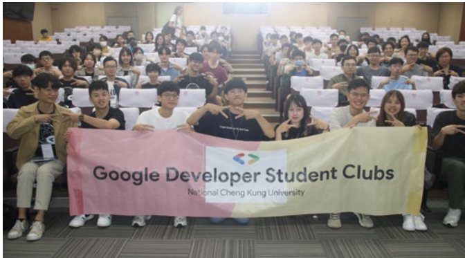
「2024 成大 GDSC 學生開發者論壇」首次在成大熱鬧登場。