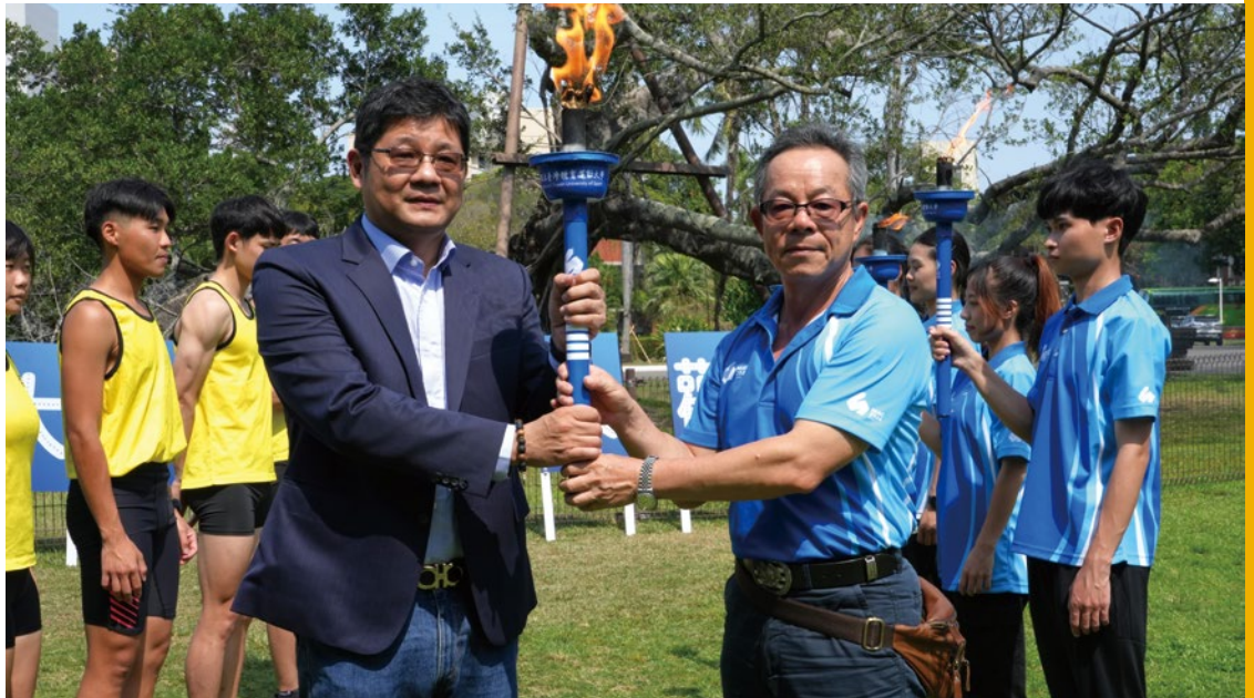
113 年全國大專校院運動會聖火傳遞到成大。