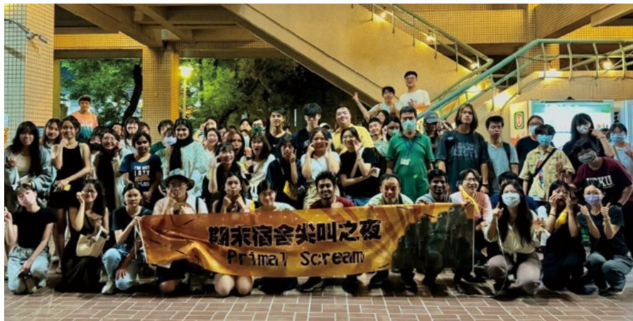
成大首辦期末尖叫之夜 讓學生放心釋放壓力再繼續前進。