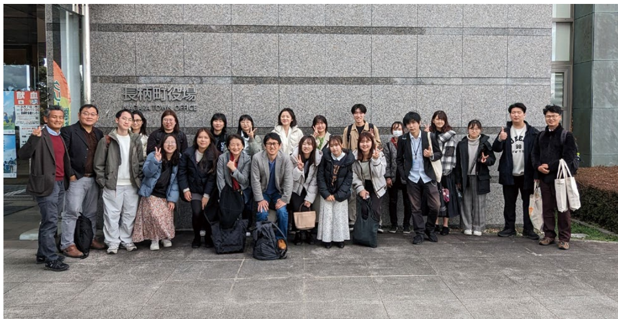
《相伴 2026》USR 臺日跨國課程《健康老化之路 在社區中學習》促進健康老化的社會更多想像與啟發。

成大圖書館舉行數位化保存舊籍與文獻資料簽署合作見證活動，將成大圖書館所典藏圖書及文獻資料數位化保存。