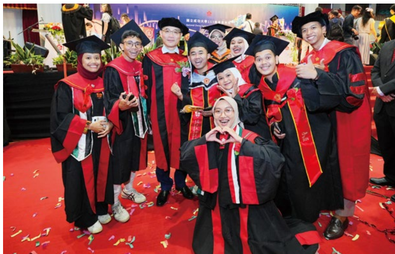
國立成功大學 113 級畢業典禮 沈孟儒校長勉勵畢業生發揮團隊合作 同理心及韌性三大特質。

國立成功大學軟體開發社 ( Google Developer Students Club, 簡稱 GDSC NCKU ) 6 月 8 日在成大多功能廳及國際會議廳舉辦「2024 成大 GDSC 學生開發者論壇」，分享專業的業界經驗，與資訊科技的發展趨勢。