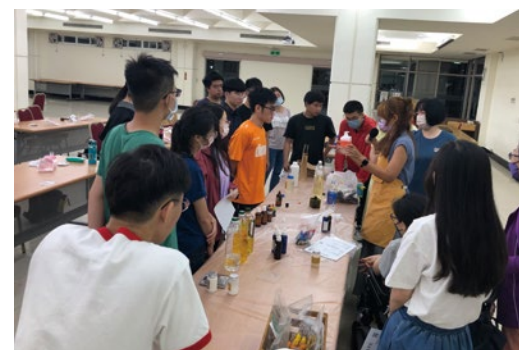
圖 19. 手作紓壓活動 - 「手作洗手乳與乳液製作」。