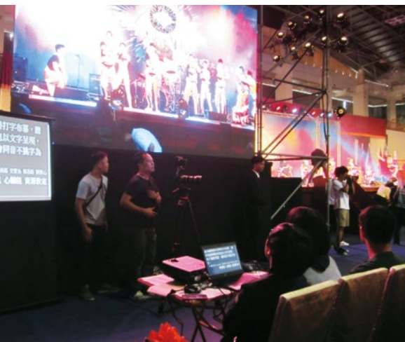
圖 24. 聽打服務支援「成功登大人新生訓練」。