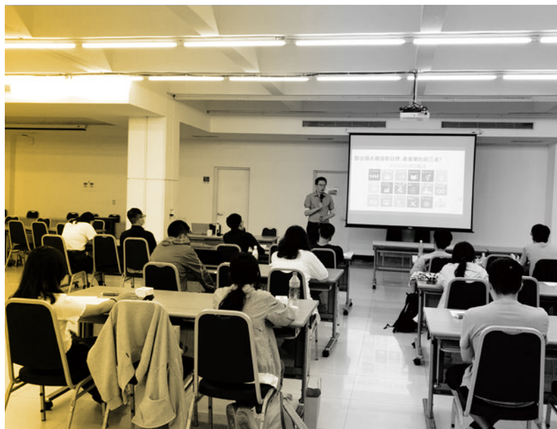
圖 16. 學職涯培能講座 - 「永續工作有哪些?來認識企業最夯的 ESG 職業!」。