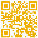
◀「成功大學資源教室」粉專

成大資源教室隸屬在學生事務處的「心理健康與諮商輔導組」，為本校特殊教育的專責輔導單位；我們的位置是在光復校區雲平東棟3樓「資源教室」(圖1)；此外，在光復校區活動中心2樓202室也有一個「友善校園中心」(圖2)的空間，可以供學生會談及進行課業輔導；另在成功校區的圖書館，身障生也可以申請1樓的「資源教室」(圖3)來進行獨立空間的使用。而在人員編制中，資源教室目前有3位輔導老師，是以學院分群的方式，來輔導系所中的身心障礙同學。以下用表列方式，來讓讀者更認識成大資源教室，若想再進一步了解我們，也很歡迎加入「成功大學資源教室」粉絲專頁(圖4)，定期會有特教新資訊傳遞與無障礙教育宣導的活動布達。