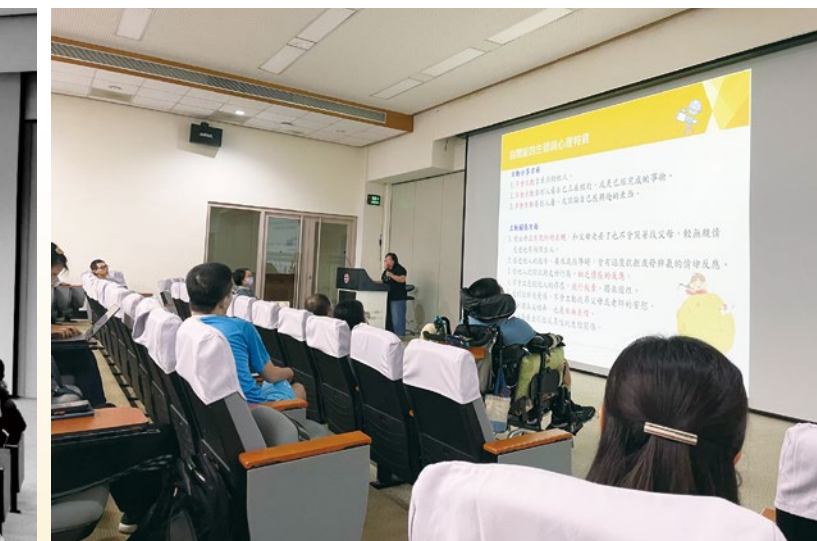
圖 28. 特教電影賞析 - [阿波羅男孩]。

為宣導校園心理與環境的無障礙理念，資源教室與台文系曾吉賢兼任副教授，共同合作拍攝有 1. 「留一條路」紀錄片(圖 29)，是關於法律系肌萎症同學，在校學習與生活的樣貌，片長 32 分鐘；2. 「看見聲音的樣子」紀錄片(聽損生與聽打員在服務中的實錄，聽損生在校園裡的狀況，片長 43 分鐘(圖 30)。上述 2 部紀錄片在放映後，觀眾的回響很大，很多都表示會反思到，原來自己可以是「軟體的無障礙」，是通用設計中的一環，能成為身障朋友即刻溫暖救援的行動工具人！