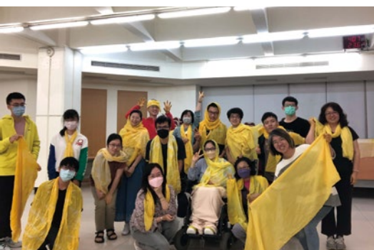
圖 17. 手作紓壓活動 - 「布料植物染圍巾」。