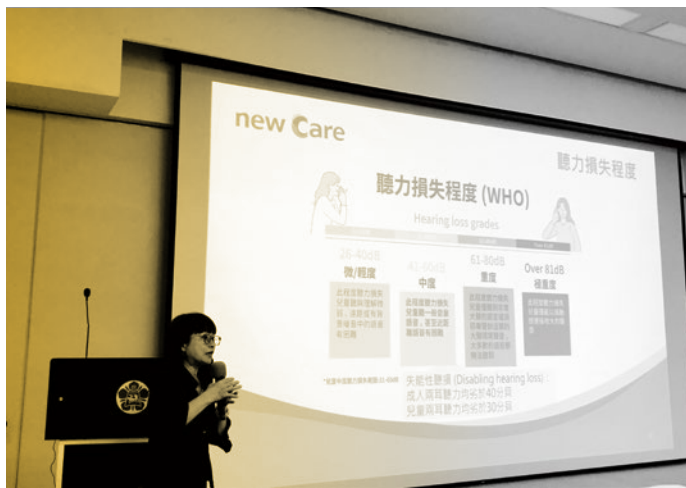
圖 25. 校園無障礙教育推廣講座-「耳朵保養之聽力保健室」。