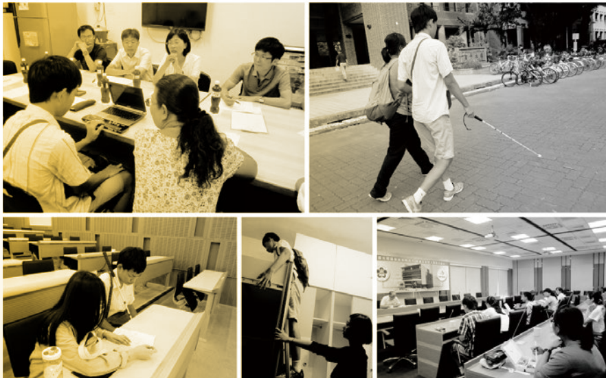
圖 11. 視障同學資料轉檔、上課帶位等服務。

②助理人員：協助資源教室學生因其障礙造成學習或生活上的困難，例如肌萎症同學的課堂協助-拿取物品(圖7)、腦麻同學的考試協助-口述後代筆(圖8)、肢體障礙同學協助-圖書館代借書籍(圖9)；聽損同學的課堂即時聽打(圖10)、筆記抄寫服務；視障同學的資料轉檔、代買餐點、上課帶位服務等(圖11)。另外，本校對於身障同學的住宿，有保留宿舍與陪宿生的服務，如有些聽損生，對於高頻音域聽不太到，於是他的陪宿同學，就可以代替鬧鐘的功能，提醒他起床，亦或當宿舍有廣播或警報時，也可以即時地提供其聲音訊息。