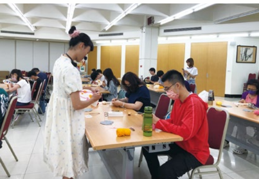
圖 20. 手作紓壓活動 - 「俄羅斯刺繡杯墊」。