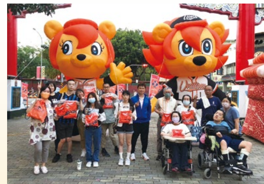
圖 22. 資源教室 VS 體育室戶外教學「觀看職棒比賽」。