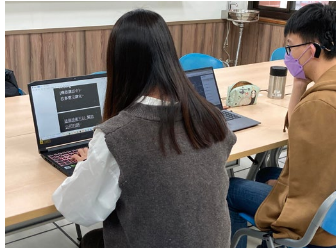
圖 10. 聽損同學課堂即時聽打。