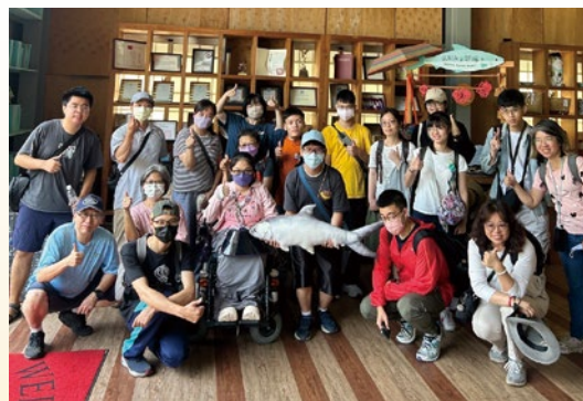
圖 21. 資源教室戶外教學活動 - 「在地人文之旅 - 漫遊漁光島」。