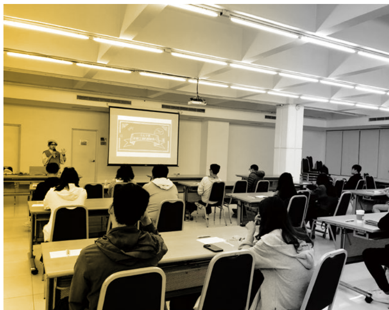
圖 14. 學職涯培能講座 - 「十人十色 - 走跳江湖的裁縫譯人」。

②參與系所輔導會議：如有招收身障學生的系所，系所每學期2次的導師會議，有時會邀請資源教室輔導老師與會，並在會議中說明報告該系所身障生目前的學習狀況，也會透過會議讓師長們了解身障生所需的課堂協助(圖13)。