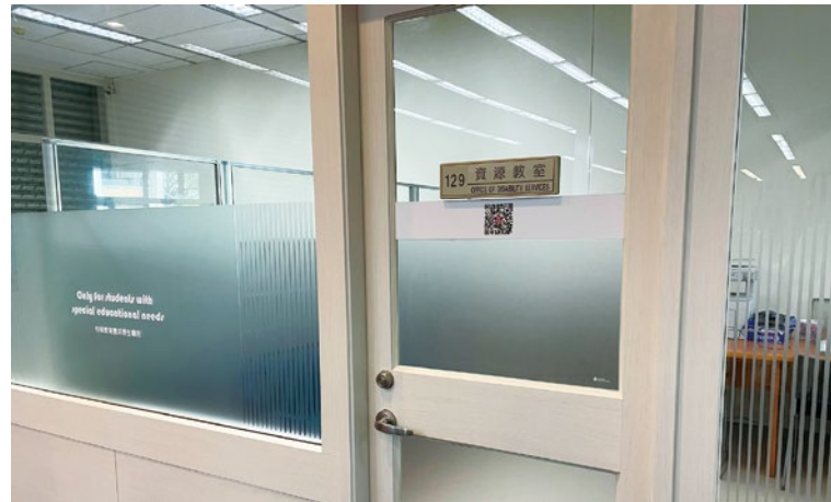
圖 3. 圖書館「資源教室」。