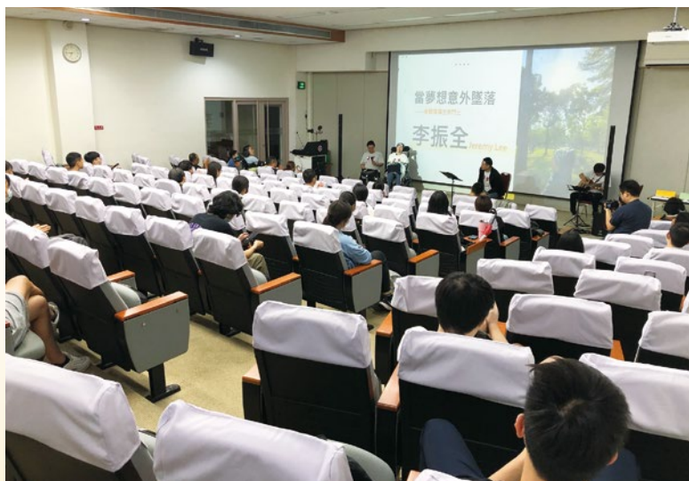
圖 26. 校園無障礙教育推廣講座 - 「當夢想意外墜落，後天致殘的重啟人生」。

能訊息的限制)；97年開課至今，已培訓出300多位專業的聽打員，在校期間除課堂服務聽損生之外，也曾支援本校大型講座，如成功登大人新生訓練(圖24)、新生家長座談會與各式大型校園講座，藉此營造友善校園的服務環境；而曾任本校聽打員的學生畢業後，仍有此聽打的第二專長，也可以在職場或各NPO組織中，擔任聽打員的服務與志願服務工作。