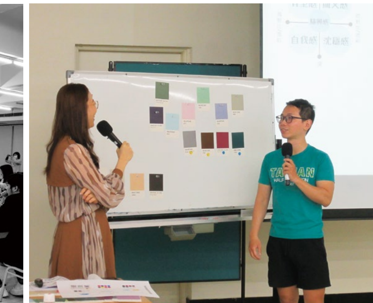
圖 15. 學職涯培能講座 - 「穿搭麻瓜的職場形象攻略」。