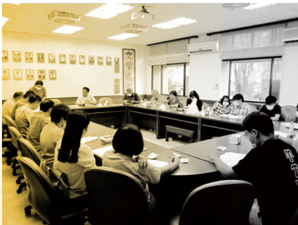
上 | 圖 12. 視障生輔具評估會議。