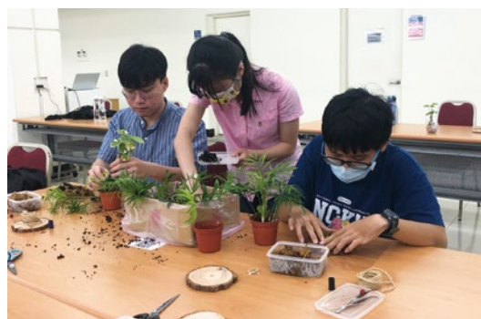
圖 18. 手作紓壓活動 - 「植物苔球種植」。