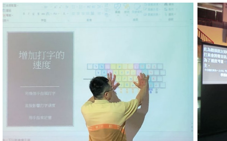
圖 23. 服務學習 (三)「校園裡的聽打員」- 聽打培訓工作坊。

每下學期開課，透過18週課程安排，先「學習」(圖23) (2場聽打培訓工作坊，外聘聽打老師到校來指導同學，實機演練如何在課堂，將教室裡老師上課及環境音聽打出來)；再「服務」(入班服務聽損同學，透過聽打讓其在課堂上，能有多一種視覺上的學習，降低因聽障帶來聽