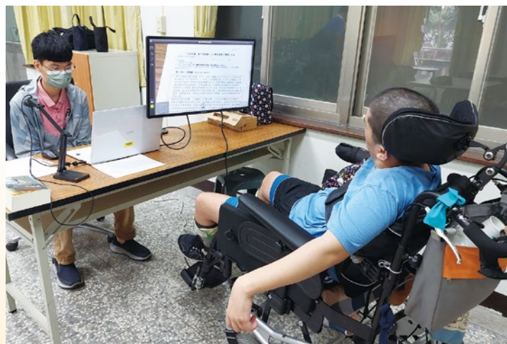
圖 8. 助理人員協助腦麻生考試代筆。