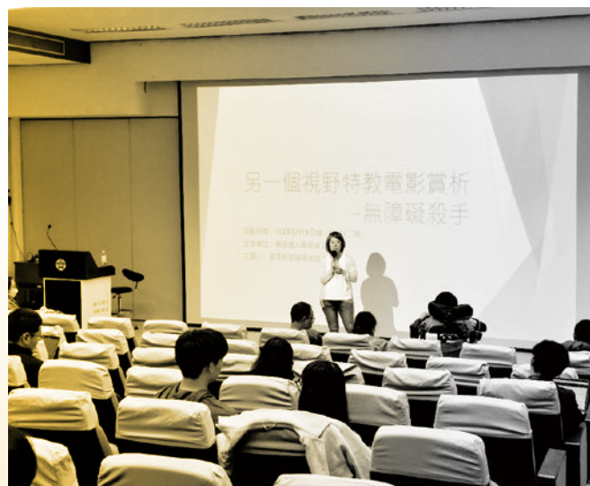
圖 27. 特教電影賞析 - [無障礙殺手]。