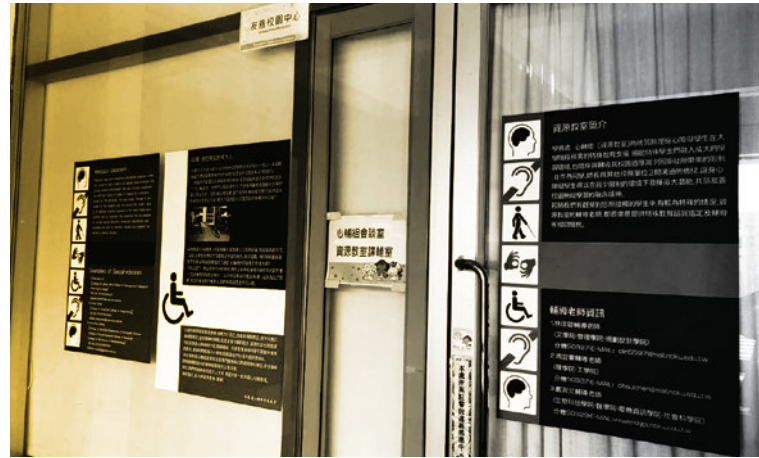
圖 2. 活動中心 2 樓「友善校園中心」。