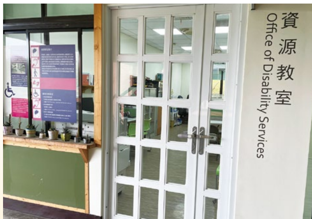
圖 1. 雲平東棟 3 樓「資源教室」。