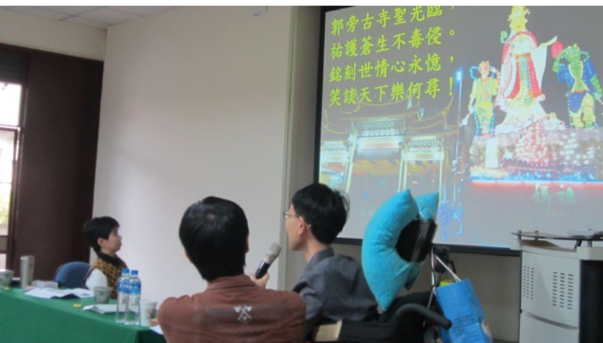
圖 7. 助理人員協助肌萎症同學。