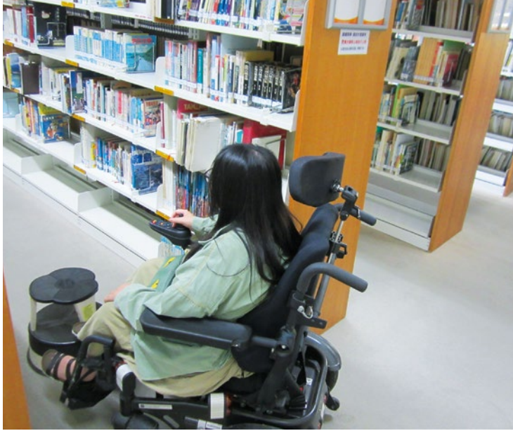
圖 9. 肢障同學圖書館代借書籍。