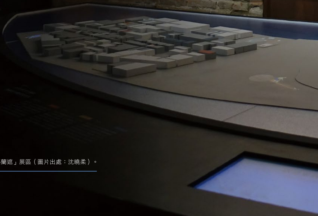
「歡迎來到熱蘭遮」展區。

荷蘭東印度公司(Verenigde Oostindische Compagnie)在17世紀東亞海上貿易中扮演了至關重要的角色。其建立的據點，如熱蘭遮城，不僅是貿易的樞紐，也是多元文化的匯聚地。這些據點的建立和發展，反映了當時全球貿易的繁榮和歐洲列強在亞洲的競爭。熱蘭遮城作為荷蘭在東印度群島最重要的據點之一，其歷史和遺產至今仍然具有重要的研究價值。