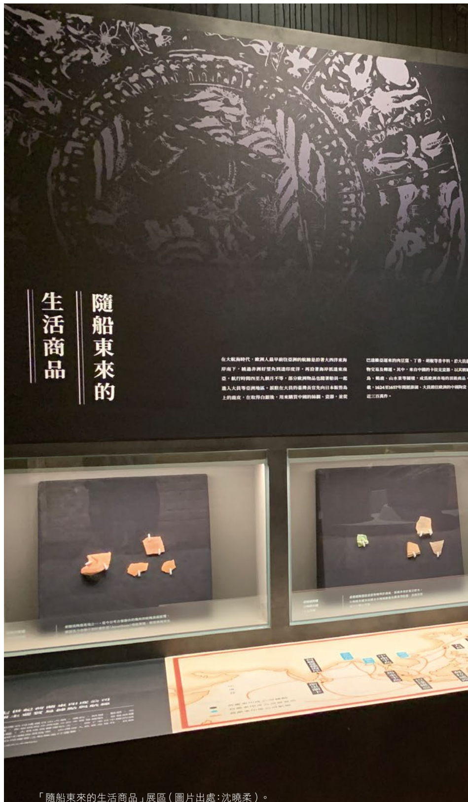
「隨船東來的生活商品」展區。

其實，臺灣的故事在二十年前亦在成功大學歷史文物館上演。國立故宮博物院在2003年1月24日至5月14日舉辦「福爾摩沙：十七世紀的臺灣、荷蘭與東亞」特展，引發各界熱烈迴響，風靡北臺灣！該年2月行政院院會裁示：為使南臺灣學子共享文化教育資源，決定「福爾摩沙：十七世紀的臺灣、荷蘭與東亞」南下延展。2003年6月21日「福爾摩沙：王城再現」特展在臺南隆重開幕。臺南為17世紀臺灣政治中心，透過故宮「福爾摩沙」特展南下延展的機會，成大歷史系共襄盛舉，在歷史文物館舉辦「大員紀事：十七世界的臺灣」特展，不僅可以呈現成大歷史系的研究成果，亦善盡與社會連結互動之大學責任。