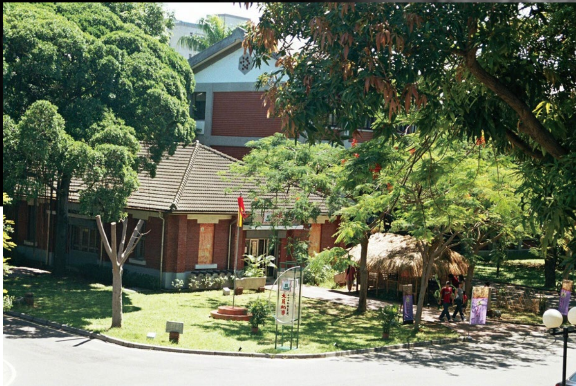
「大員紀事」特展。

成大歷史文物館的空間並不大，在時間、空間有限的情況下，成大歷史系以扎實豐富的學術研究，結合來自各方（政府機關、相關博物館、企業界等）的熱情協助，策展工作小組共規劃八個展覽主題：一、臺灣的先住民；二、漢人渡海而來；三、與世界接觸—成為國際轉口港；四、與世界密切接觸—臺灣出產世界級的商品，鹿皮與砂糖；五、磚與