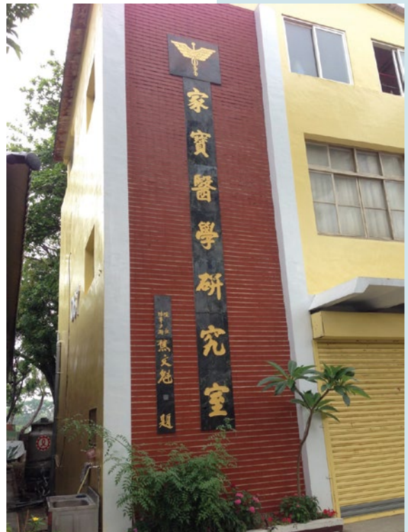
附圖取在維基百科「家寶醫學研究室」詞條。 https://zh.m.wikipedia.org/zh-tw/%E5%AE%B6%E5%AF%B6%E9%86%AB%E5%AD%B8%E7%A0%94%E7%A9%B6%E5%AE%A4

長的焦文魁題字後，作成黑色大理石為底之直式金字「家寶醫學研究室/院長陸軍少將焦文魁題」等字樣鑲在建築前面左側紅磚立面上，「家寶醫學研究室」字樣上面則有軍醫院的統一院徽(如下附圖)。