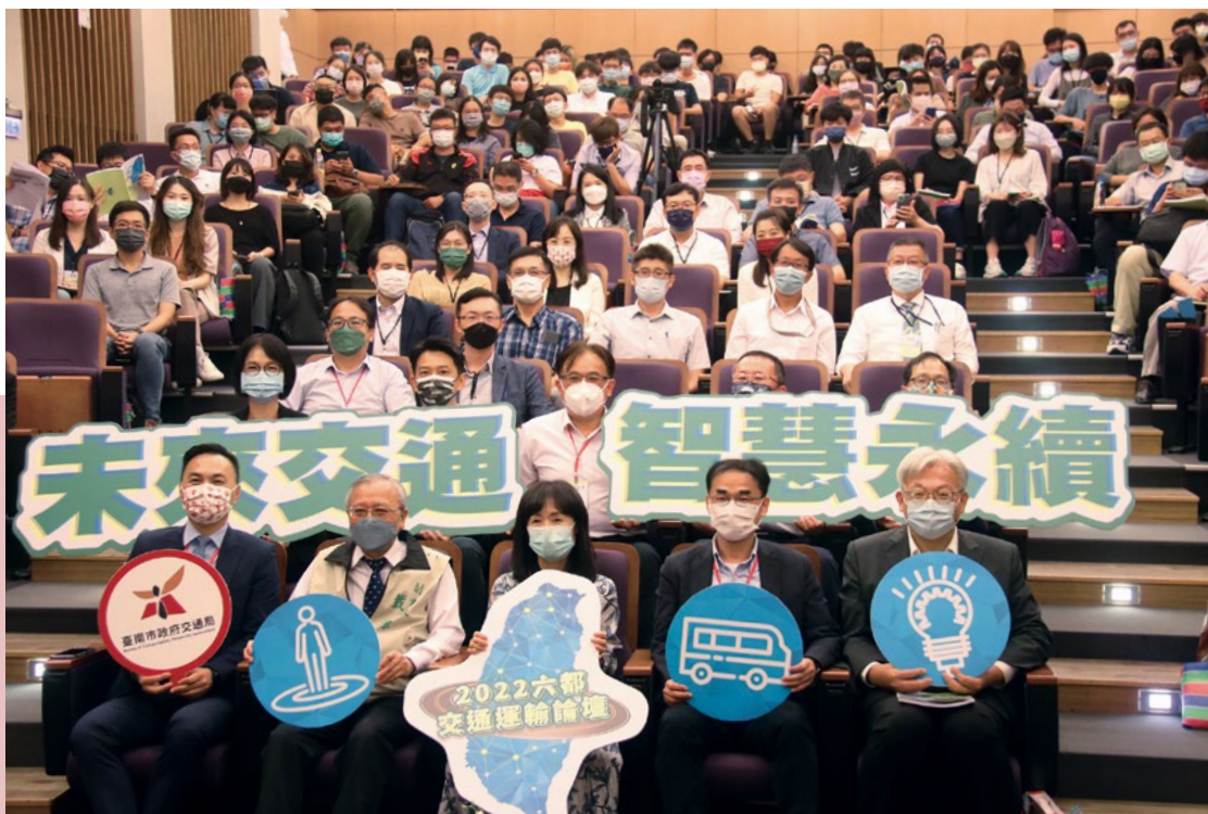
未來交通智慧永續 2022 年六都交通運輸論壇 成大攜手六都交通局邁向綠能智慧城市。

國立成功大學前瞻醫療器材科技中心成員籌組團隊參加國際徵案，連續3年獲得由中研院及美國國家醫學院發起之「健康長壽大挑戰計畫」的「催化創新獎」！2022 年該計畫8 組獲選團隊，其中 3 組團隊成員出自成大前瞻醫材中心。