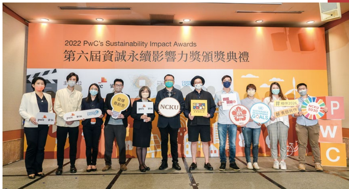
全國唯一獲獎頂大 2022 資誠永續影響力獎成大永續漁電奪銅獎。