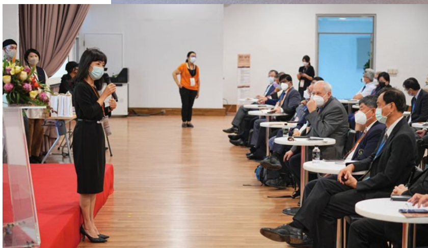
臺南低碳城市會議成大登場 集結跨界量能推動永續人才培育。