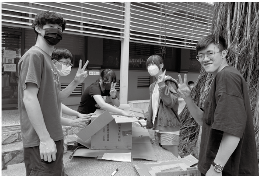
學生以廢棄物創作新產品，具現化永續循環概念。

被稱為「護國神山」的台積電，呼應聯合國永續發展目標，除推動綠色製造、打造多元包容職場外，也積極關懷弱勢；無獨有偶，作為全球電源供應器龍頭的台達電，在氣候變遷議題上也做出企業自主減碳、揭露氣候變遷資訊等承諾，更以2030年全球廠辦100%使用再生電力及達成碳中和為目標而努力；相較於容易產生可見污染的製造業，在乍看之下似乎難與永續產生聯想的金融業中，玉山銀行也於今（2022）年設立「永續長」職位，在掌握企業擴增產能與綠能商機的同時，更積極協助企業進行轉型減碳，以自身經驗帶領其他產業一同在永續發展的路上前進；除了大型跨國企業外，臺灣許多零售業也陸續提出淘汰塑膠包裝的願景，而我也和綠色和平組織合作，利用產學合作的機會與零售商共同商討蔬果裸賣等減塑方案的可行性，並且召開記者會發表研究結果，期待以學術研究的角度幫助企業一同達成減塑、永續目標。