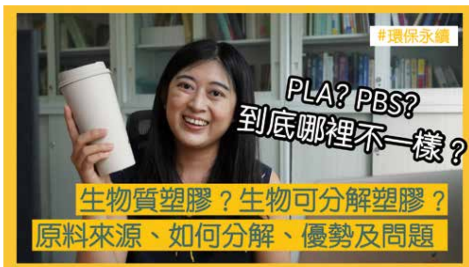
永續生活家分享專業知識也討論日常生活的話題。