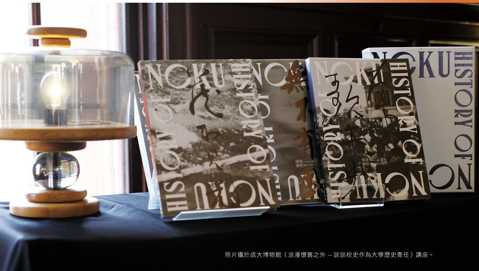
照片攝於成大博物館〈浪漫懷舊之外 -- 談談校史作為大學歷史責任〉講座。