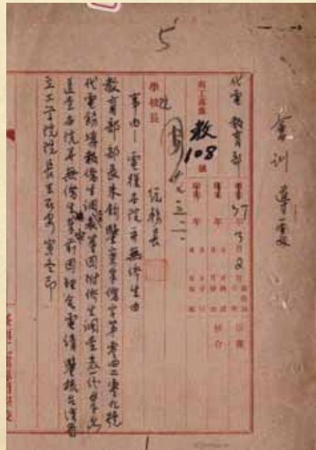
(b) 本校之教字第 108 號