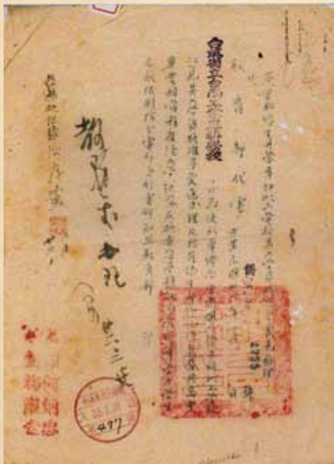
圖 1 教育部代電僑務委員會之僑字第 4755 號公文