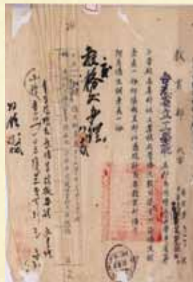
圖 3 (a) 教育部代電之僑字第 41380 號公文

(訓字第175號，圖6)中，附上蔡子威在36學年度兩學期(第三學年第一、二學期)的成績單。