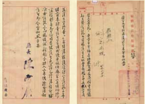
圖 7 台灣省政府教育廳之肆零西感教二字第 30758 號公文

酌予轉入二年級。於是，方培君在40學年度第一學期轉入機械系就讀二年級一事，於民國41年報教育部同意備案。