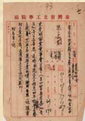
圖 6 訓字第 175 號公文