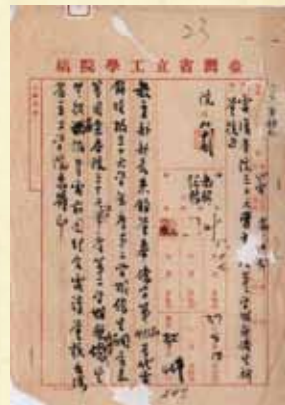
(b) 本校之教字第 447 號公文