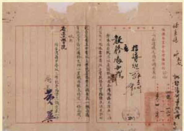
圖 4 僑務委員會台灣僑務局 (38) 總字第 120 號公文