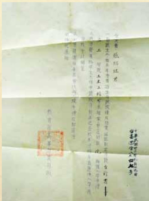
圖 8 教育部高教司寄送張紹竑學長之入學通知單

依據民國42年9月22日的香港時報(土木系46級張紹竑學長捐贈的文物、成大博物館典藏)，刊載港澳高中畢業志願來台升學專科以上學校錄取第一梯次僑生的榜單，參與招生的學校及錄取名額分別是國立台灣大學(63名)、台灣省立師範學院(47名)、台灣省立農學院(31名，國立中興大學前身)、台灣省立工學院(43名，46級畢業的土木系張紹竑亦名列其中(圖8))、台灣省立海事專科學校(14名，國立海洋大學前身)、國防醫學院(36名)，台灣省立地方行政專科學校(43名，國立台北大學前身)、台灣省立台北工業專科學校(27名)、計8校308名(作者註：合計人數有異)僑生。時任教育部次長高信(字人言，廣東省新會縣龍泉鄉人，1905年生)稱，國民政府已經盡最大努力達成僑生最大願望，尚有第二梯次錄取的240名。