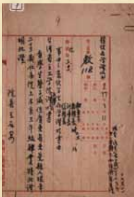
圖 5 本校之教字第 118 號文